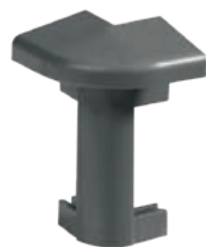
Narożnik zewnętrzny External corner Aussenecke