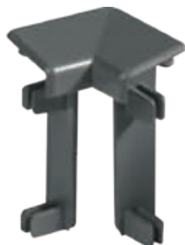
Narożnik wewnętrzny Internal corner Innenecke